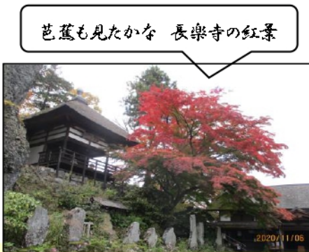
芭蕉も見たかな 長楽寺の紅葉