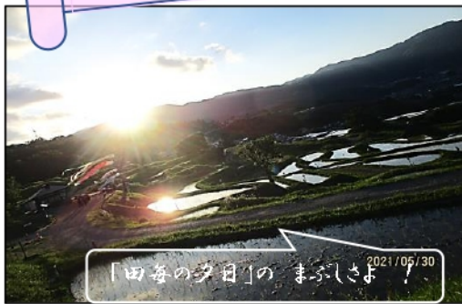
「田舎の夕日」の まぶしきよ 2021/05/30

あなたのステキな「さらしな」「千曲市」その一瞬をパチリ！ そして特別な「ひと言」をそえてね！