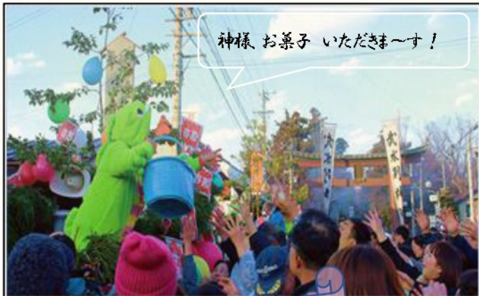
神様 お菓子 いただきま〜す！