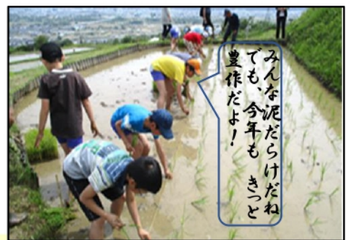
みんな泥だらけだね でも、今年もきつと 豊作だよ！