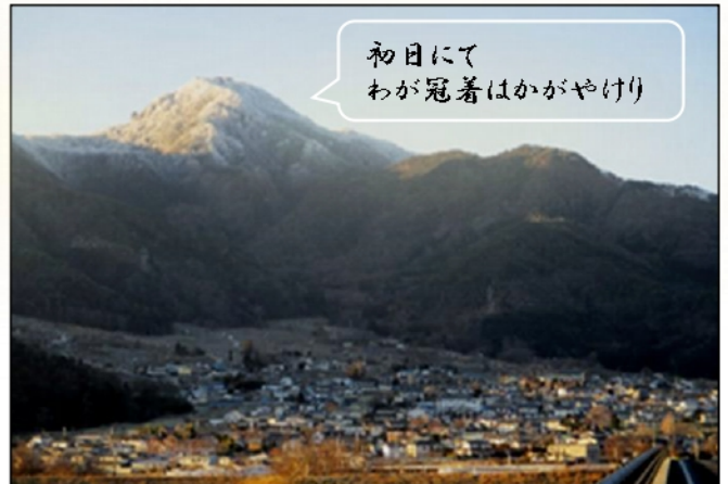
初日にて わが冠着はかがやけり

昨年六月、千曲市は、「月の都」として、日本遺産に選定されました。 千曲市西部に位置する「さらしなの里」は、平安時代から皆がここが「月の都」として有名だったのです。