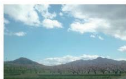
塩崎地区の視程から冠着山を眺めました