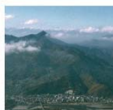
五里ヶ峯から見た冠着山。若々し ブス