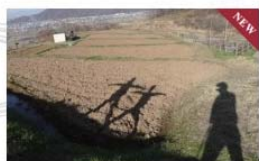
落日前のたわむれ