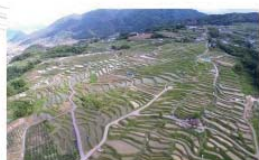
国の重要文化的景観の焼畑の棚田。小型無人機ド ローンで撮影