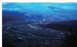
冠着山頂から見た千曲市・さらしなの里の夜景